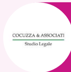
Cocuzza & Associati

L'attività retail real estate si presenta nel primo semestre dell'anno sostanzialmente stabile. Tendenzialmente la vivacità maggiore si registra sul fronte centri storici. Flagship anche importanti nelle principali vie commerciali delle città stanno vedendo la luce, investimenti che probabilmente erano rimasti in pipeline durante il periodo Covid. Le rinegoziazioni e i calmieri degli aumenti ISTAT sono stati portati avanti in trattative private, spesso non pubblicizzate.